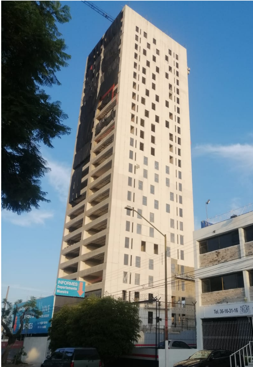
Fachada Poniente: Aplanados en Fachada: 90% Avance