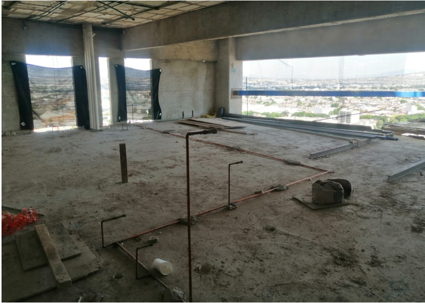
Nivel 21 Instalación de Gas