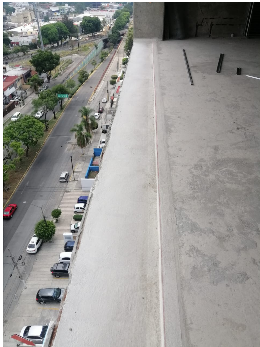
Nivel 10 Impermeabilizante en Terraza