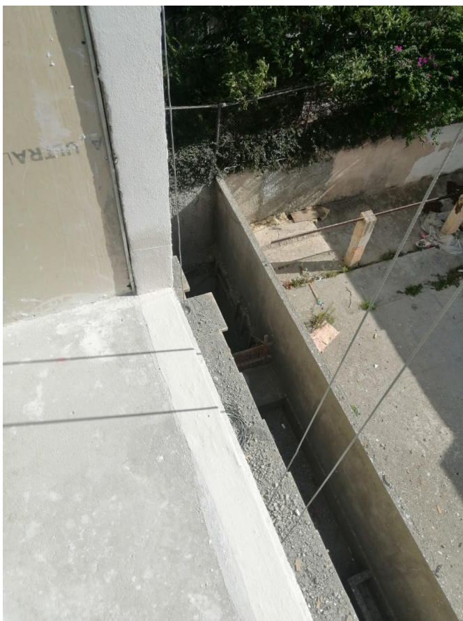
Nivel 21 Instalación de Gas