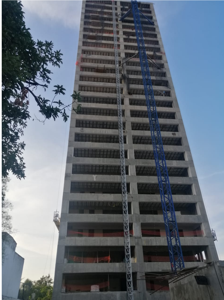
Fachada Norte Estructura Terminada al Nivel 25 (Azotea)