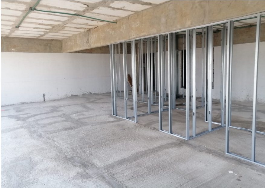
Nivel 19 Yeso