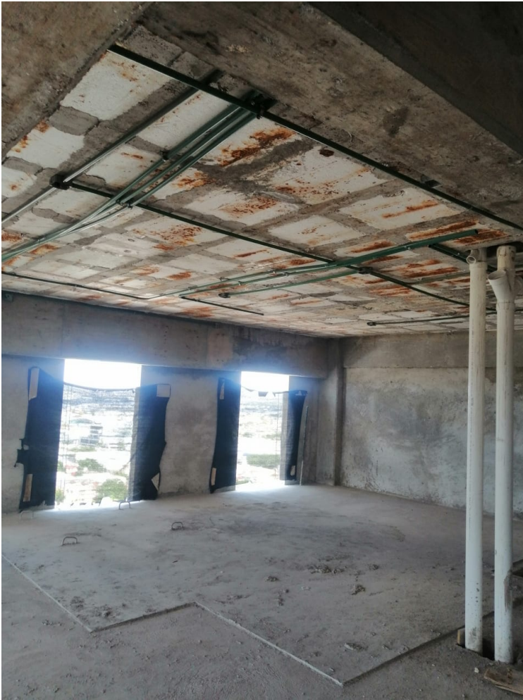
Inst. Eléctricas en Losa Nivel 22