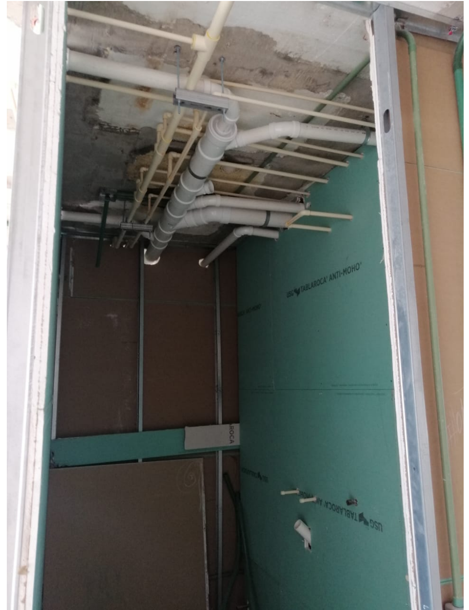
Nivel 16 Inst. Hidrosanitarias