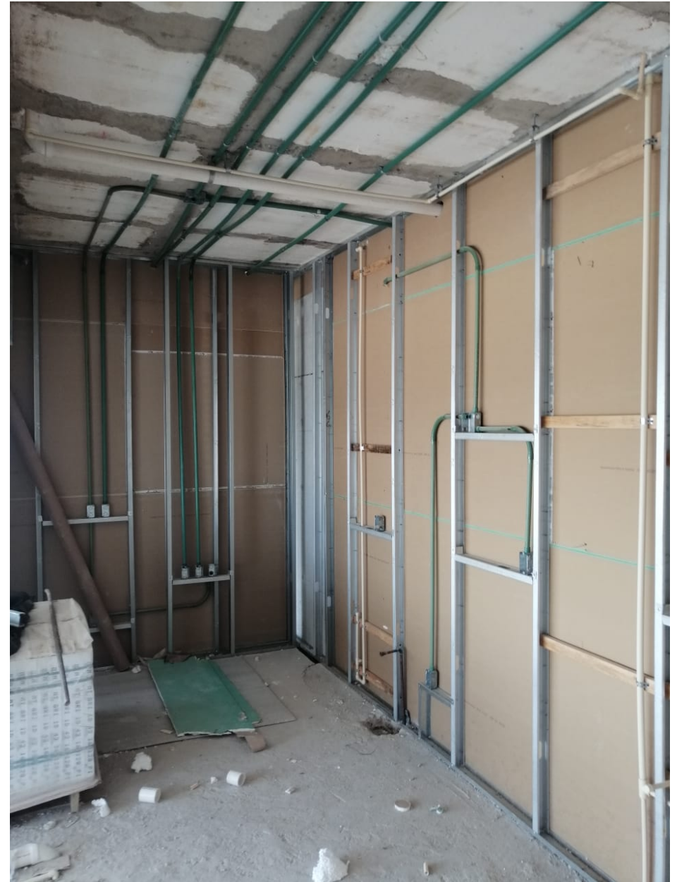
Nivel 18 Inst. Eléctricas en Muro