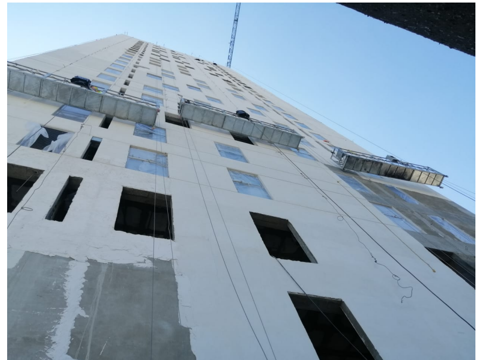
Fachada Poniente Ventaneria y Louver