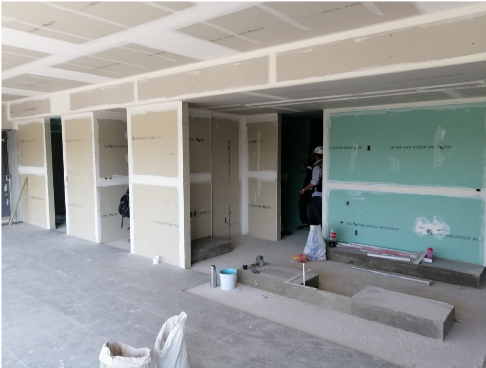
Nivel 03 Tablaroca a 2 Caras