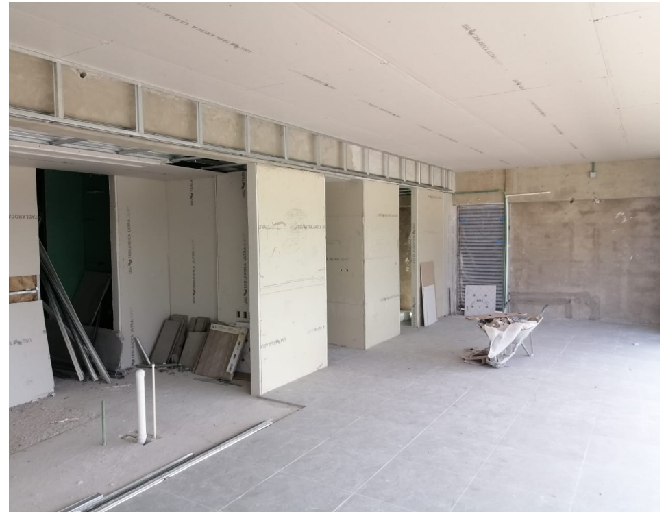
Nivel 10 Tablaroca en Muro y Plafón