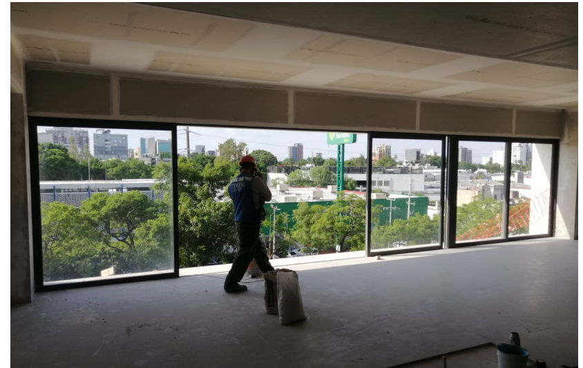
Nivel 03 Cancel Corredizo