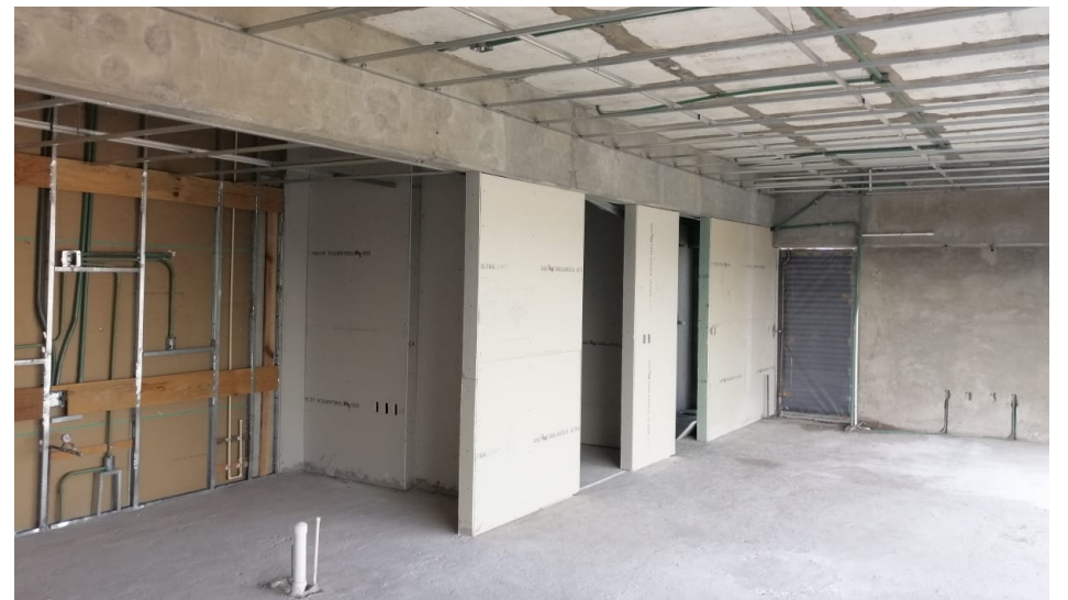
Nivel 07 Tablaroca a 1 Cara y Soporteria en Plafón