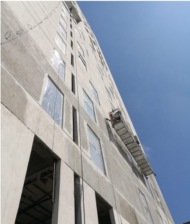
Fachada Poniente Ventaneria y Louver