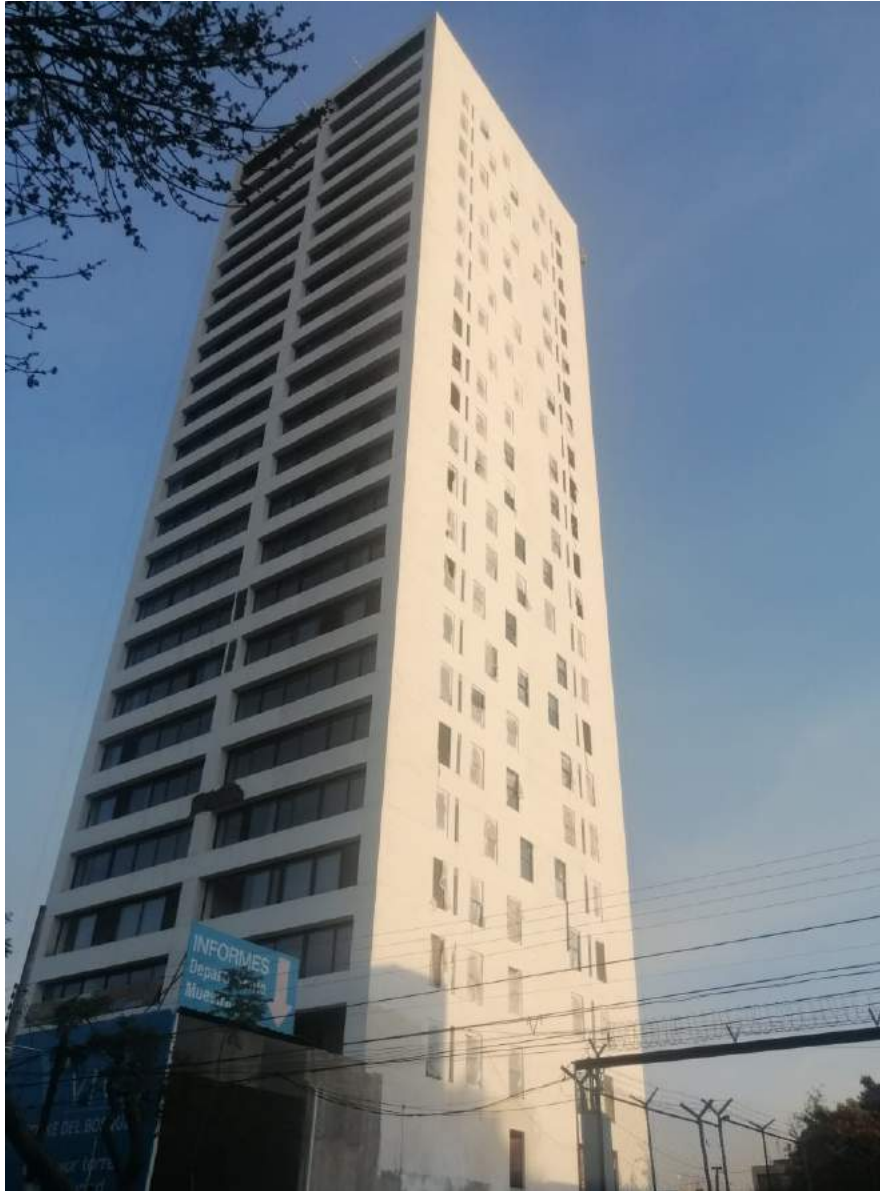
Fachada Poniente: Pintura en Fachada: Finalizado