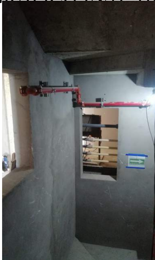
Hidrantes (Nivel 23)