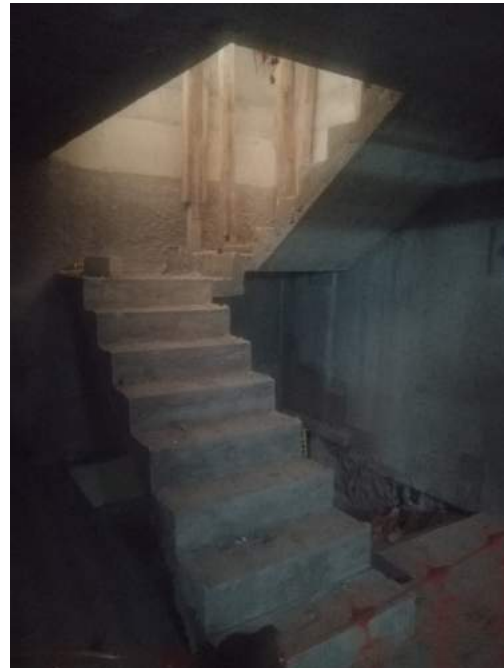
Escaleras Sótano 2 y 3