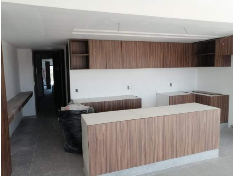
Cocina Tipo LUNA