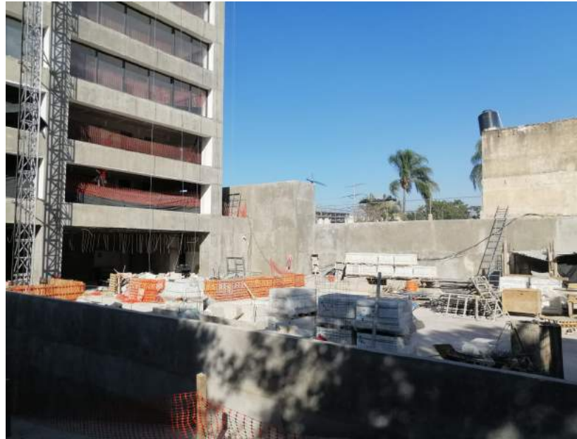
Exterior Plazoleta- Terraza