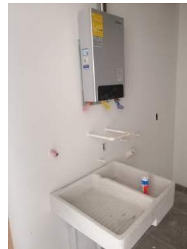
Calentador (Nivel 5)