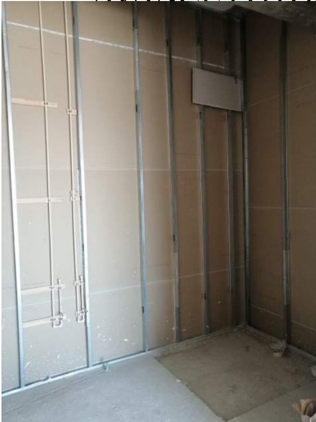
Inst. Hidrosanitarias (Nivel 24)