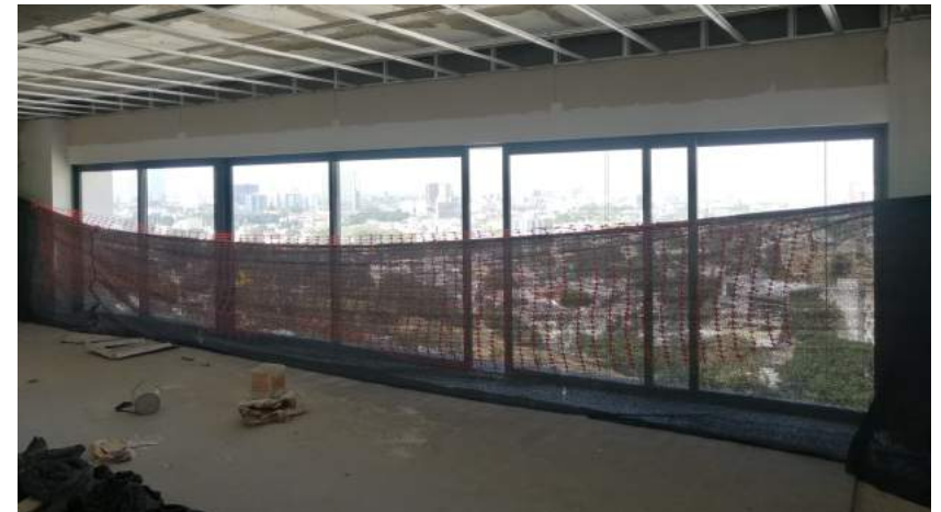
Cancel Corredizo (Nivel 16)