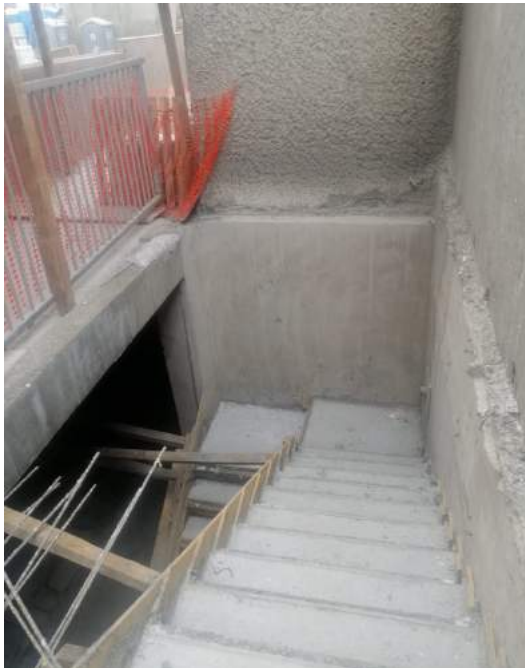
Escaleras a Sótano 1