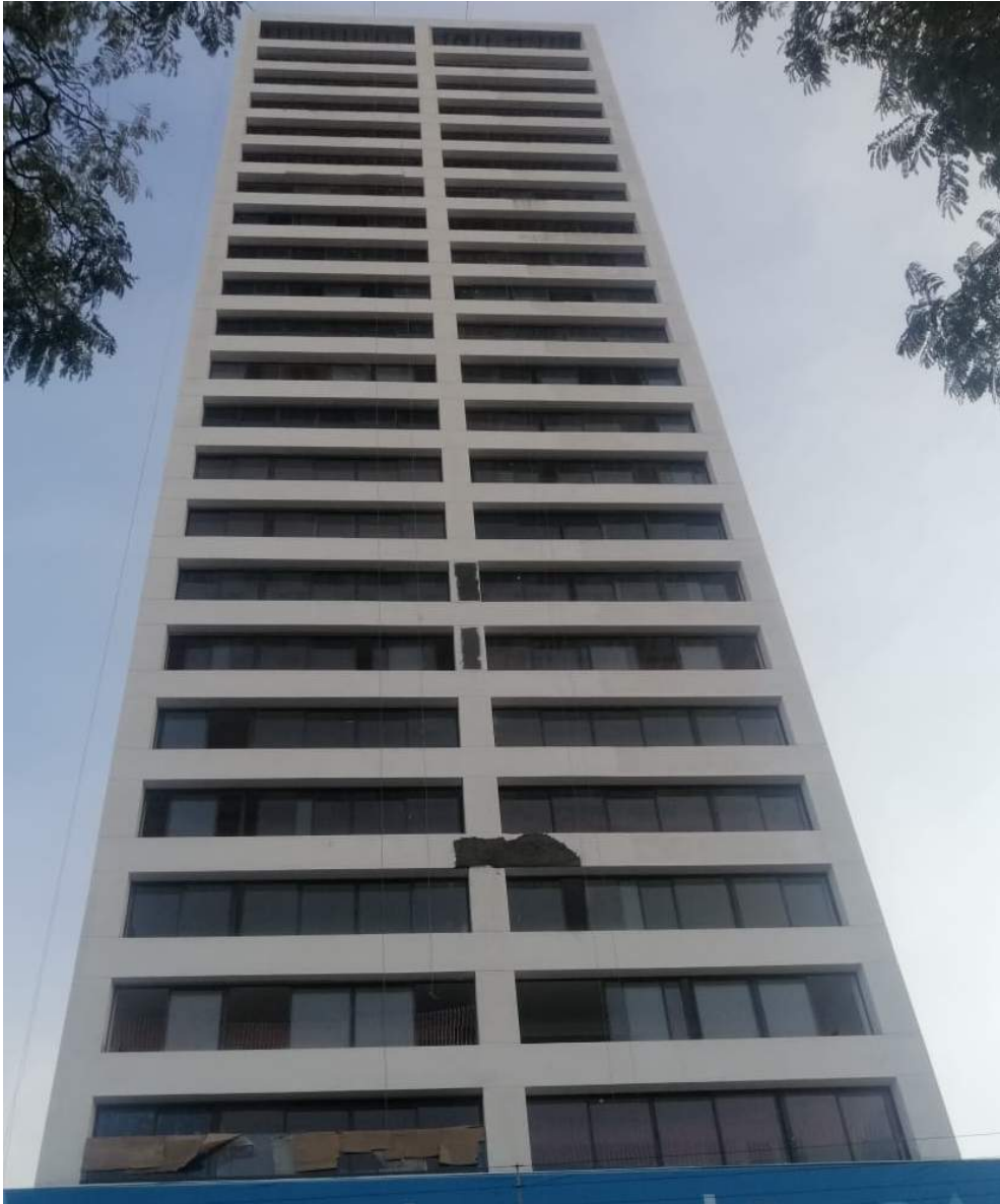
Fachada Norte: Aplanados en Fachada: Detallando