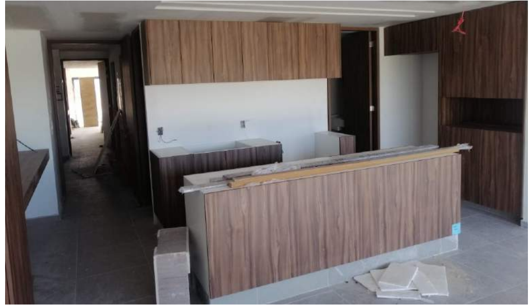
Cocina Tipo BOSQUE