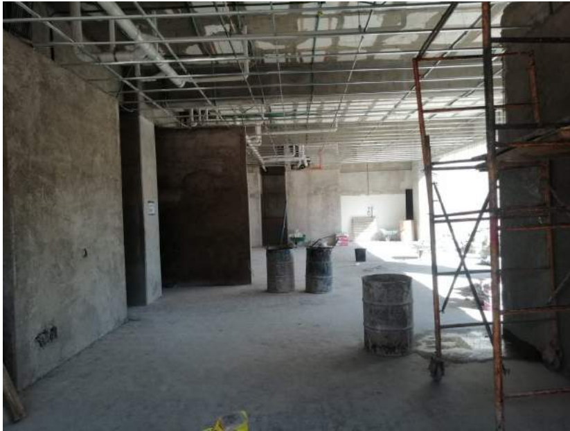
Planta Baja Lobby