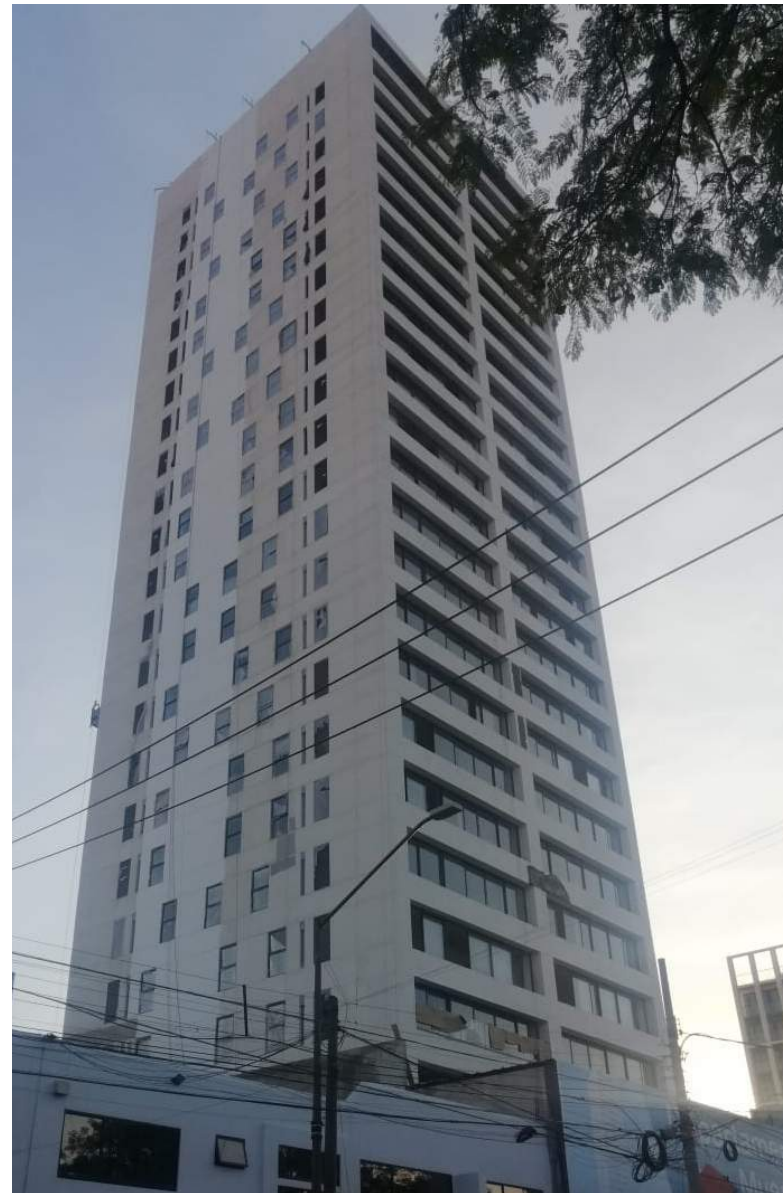
Fachada Oriente: Pintura en Fachada: 25% Avance