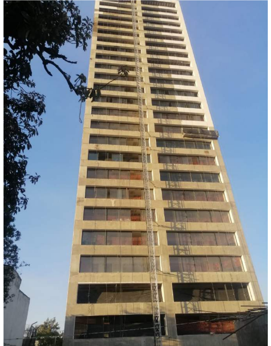
Fachada Sur Aplanados en Fachada: 20% Avance