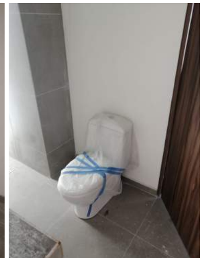
WC (Nivel 3)