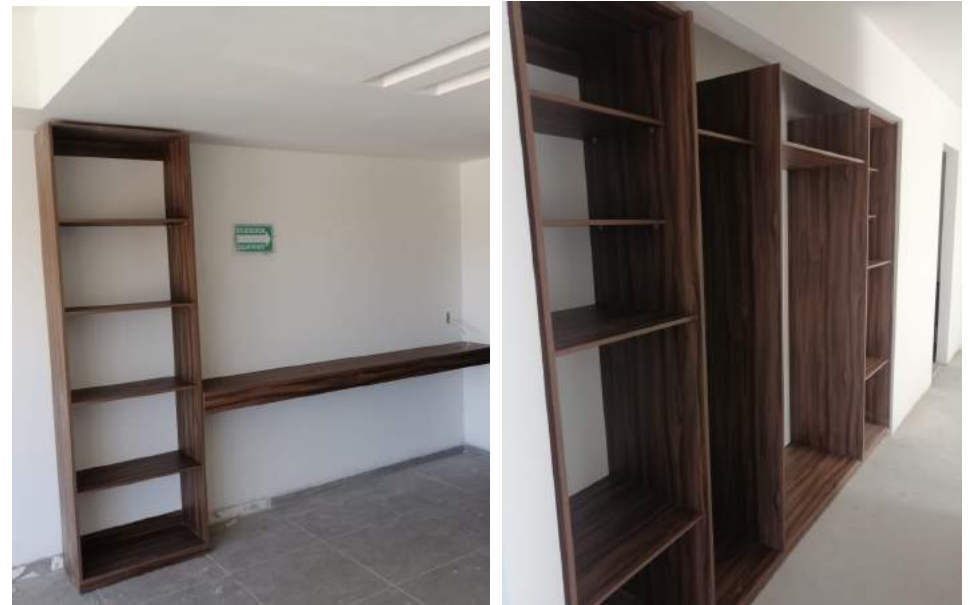
Carpintería (Nivel 7)